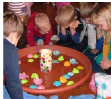
Konzentriert und vertieft feierten Kinder einen der vergangenen Kinderwortgottesdienste

Sonntag, 28. 09. 2014 8:30 Uhr im Pfarrheim Sonntag, 16. 11. 2014 8:30 Uhr im Pfarrheim