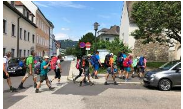
Unterwegs zum Ziel des einwöchigen Pilgerweges: Die Martinskirche in Linz

Wir haben Grenzerfahrungen bewältigt, aus dem Lebensrucksack alte, belastende Dinge ausgepackt, sie bei der Versöhnungsfeier Gott hingelegt und neue, stärkende Erlebnisse in den Rucksack eingepackt. „Einer trage des anderen Last“, dieses Wort aus der Bibel konnte hautnah erlebt werden. Mit Dankbarkeit und Freude geht nach der gemeinsamen Woche wieder jede/jeder seinen eigenen Weg. Was bleibt, sind die Erfahrungen des gemeinsamen Weges, die Kraft und Mut geben für den je eigenen Lebens- und Glaubensweg.