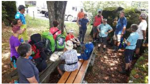
Pause auf dem Weg: Zeit zum Rasten, zum Gespräch, zum Innehalten von Leib und Seele

Beim Pilgern wird das Leben einfach. Es beschränkt sich auf gehen, essen, schlafen, im Rucksack ist nur das wirklich Notwendige. Die Impulse des Cursillo bringen in Berührung mit dem Wesentlichen des Christseins. So durften wir Begegnung erleben mit Gott, mit uns selbst, in der Pilgergruppe und mit Menschen, die uns begegnet sind. Wir wurden willkommen geheißen und herzlich aufgenommen.