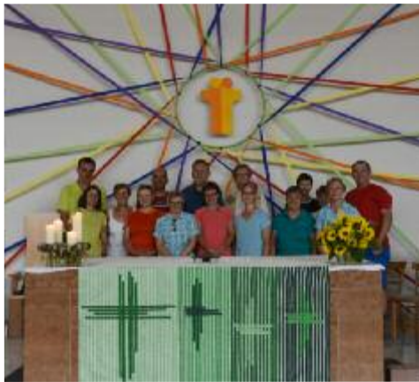
Gottesdienst in Walding

Wir haben Grenzerfahrungen bewältigt, aus dem Lebensrucksack alte, belastende Dinge ausgepackt, sie bei der Versöhnungsfeier Gott hingelegt und neue, stärkende Erlebnisse in den Rucksack eingepackt. „Einer trage des anderen Last“, dieses Wort aus der Bibel konnte hautnah erlebt werden. Mit Dankbarkeit und Freude geht nach der gemeinsamen Woche wieder jede/jeder seinen eigenen Weg. Was bleibt, sind die Erfahrungen des gemeinsamen Weges, die Kraft und Mut geben für den je eigenen Lebens- und Glaubensweg.