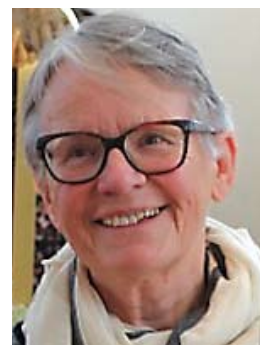
Emma ZUCALI , 1948 Integration, Liturgie

Wahllokal ist der Vorraum der Pfarrkirche St. Franziskus, Neubauzeile 68 4030 Linz Wahlzeiten: Am Sonntag, 19.03.2017, von 8.00 bis 9.30 und von 10.15 bis 11.45 Uhr