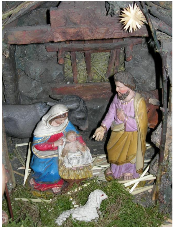
Krippe in unserer Kirche Berg

In deinem Herzen will es Weihnachten werden, wenn du darin die Krippe aufstellst, um das göttliche Kind bereitwillig anzunehmen in seiner wehrlosen und verwundbaren Liebe zu dir.