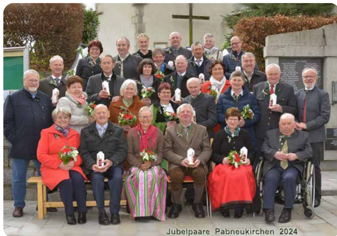
Jubelpaare Pabneukirchen 2024