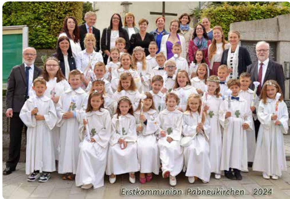
Erstkommunion Pabneukirchen 2024