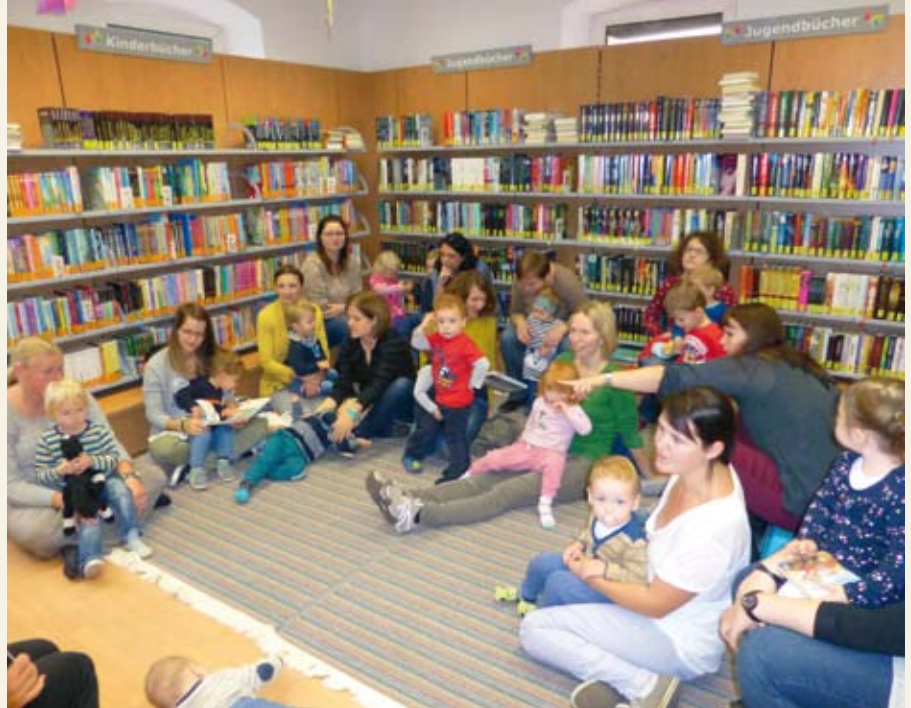
24 Familien kamen zum Buchstart-Frühstück in die Bibliothek

Und natürlich werden auch heuer wieder am ersten Adventsamstag die fleißigsten jungen Leserinnen und Leser belohnt.