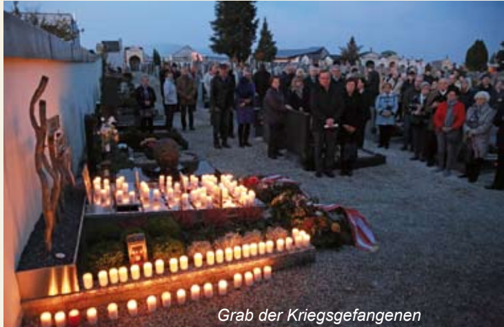
Grab der Kriegsgefangenen