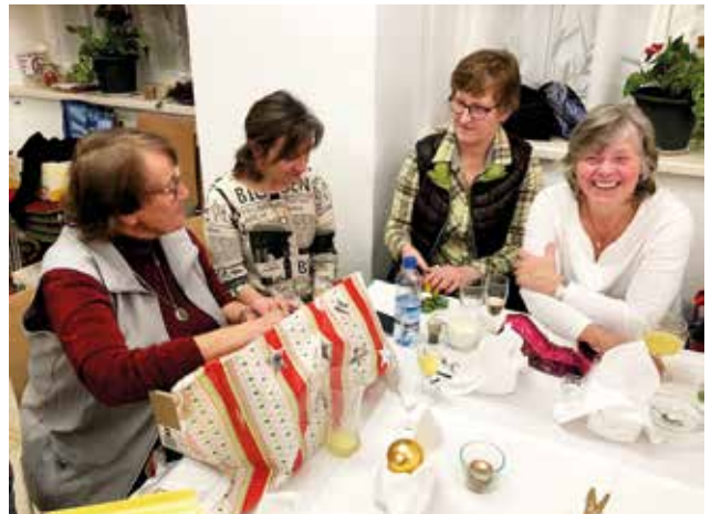
Heitere Chorweihnachtsfeier mit den Wichtelgedichten

Das vollständige Gedicht findet sich auf der Website: www.pfarre-badgoisern.at