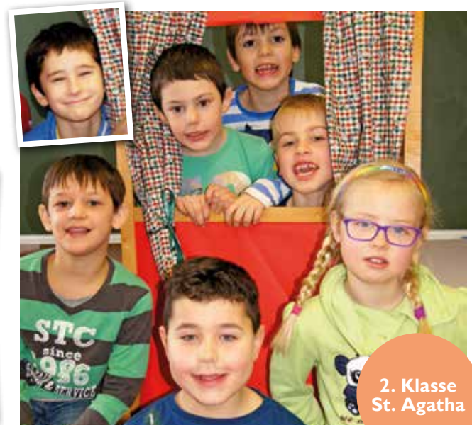
2. Klasse St. Agatha