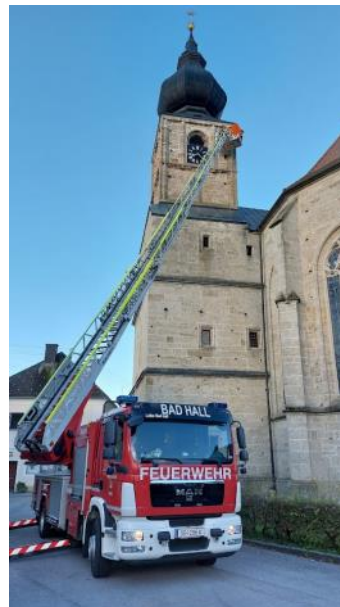
Verschließen der Gerüstlöcher