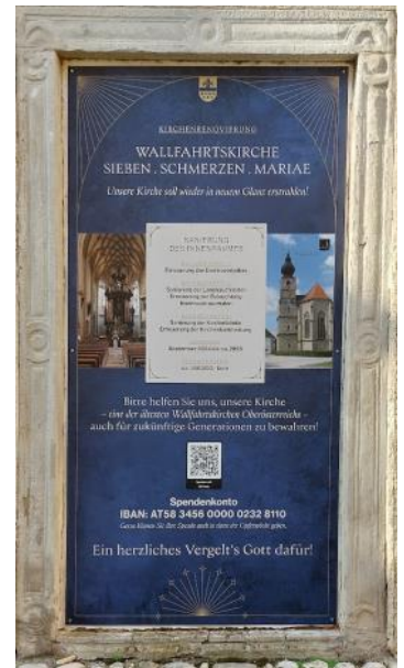
Spendentafel im Eingangsbereich der Kirche

Um die Nistaktivitäten der Dohlen an der Außenfassade der Kirche und die damit einhergehende starke Verschmutzung des Kirchenvorplatzes großteils zu unterbinden, wurden jene Gerüstlöcher, die tiefer in das Mauerwerk hineinragen, auf eine Tiefe von etwa 7cm mit Kremsmünsterer Kongolmerat-Bruchsteinen verschlossen. Wesentlich beigetragen hat zu einer erfolgreichen Durchführung dieses Vorhabens neben den freiwilligen Helfern das Drehleiterfahrzeug der Feuerwehr Bad Hall, das der Pfarre mit 2 Mann Besatzung zur Verfügung gestellt wurde.