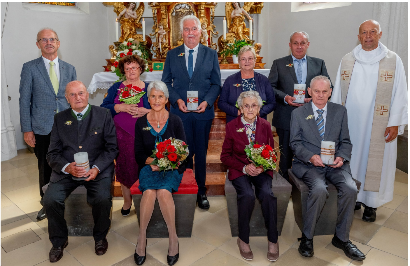
Der Kulturverein und die Pfarre luden zur Jubelpaarfeier in St. Willibald am 13. Sept. 2023 ein.

2 Paare, die 60 Jahre bzw. 2 Paare, die 40 Jahre verheiratet sind, folgten der Einladung.