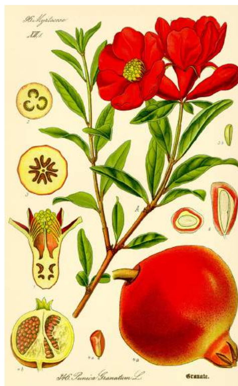
Zyperblume (Granatapfel) - eine Pflanze der Bibel (Hohelied 7,12)

Aus Artikel „Zwischenruf“ von Jutta Henner, Direktorin der Österreichischen Bibelgesellschaft, vom 14.2.2021