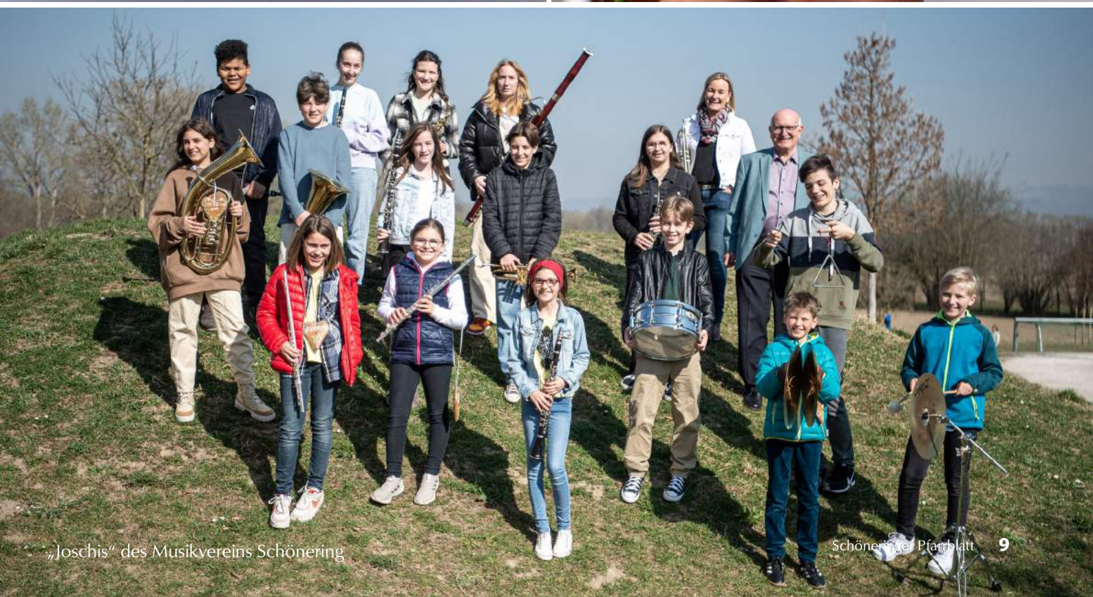
„Joschis“ des Musikvereins Schönering