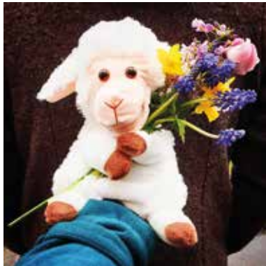
Auch dieses Jahr freut sich Kiki über eure mitgebrachten Blumen am Ostersonntag