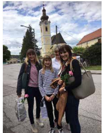
Freude über fair gehandelte Rosen