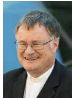
Bischof Manfred Scheuer

So grüße ich Sie alle in Vorfreude auf den Besuch bei Ihnen im Dekanat Eferding. + Manfred Scheuer Bischof von Linz