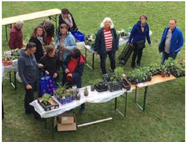
Vorbereitungen für den Pflanzenmarkt

beim Familien- und Jugendmessteam, dass sie unser Thema immer bereitwillig aufnehmen und mittragen