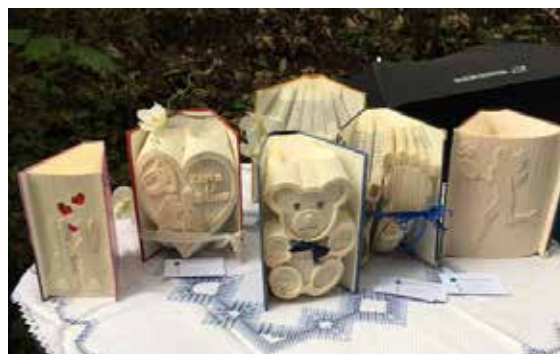
Sachen zum Staunen bei der Kunstmeile

Erstmals wurden am 11. Mai im Spar Markt Strasser, in der Bäckerei Moser und beim Kleidertausch Fair Trade Rosen verteilt. FAIRTRADE Österreich hatte zu einer großen Rosen Challenge aufgerufen, um das FAIR-TRADE Siegel ins Bewusstsein zu rücken.