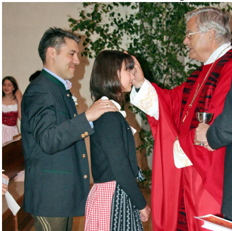
v. l.: Pate, Firmling, Firmspender

Firmung ist ein Sakrament und damit ein besonderes, heiliges Zei-