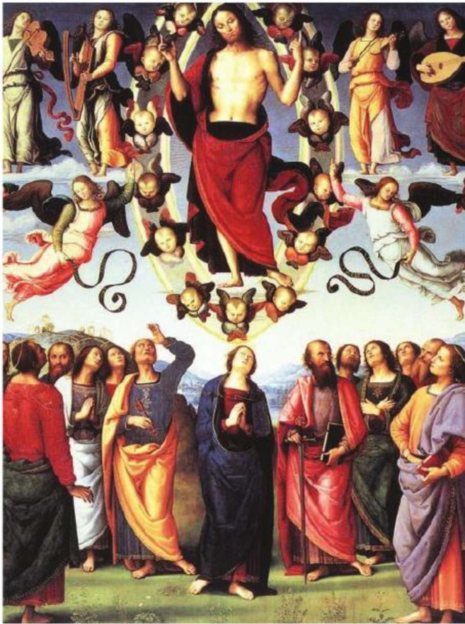
Pietro Perugino, 1496 - 98, kommunales Museum der schönen Künste in Lyon

Christi Himmelfahrt wird 40 Tage nach dem Ostersonntag , also immer an einem Donnerstag, begangen. Diese 40 Tage gehen zurück auf das Zeugnis des Lukas: Den Aposteln erwies er sich nach seinem Leiden auch durch viele Beweise als lebendig, indem er ihnen während vierzig Tagen erschien und über das Reich Gottes redete (Apg 1, 3). Sowohl das Lukas-Evangelium als auch die Apostelgeschichte berichtet, wie Jesus, nachdem er am Ostertag von den Toten auferstanden war und immer wieder mit seinen Jüngern gesprochen hatte, vor ihren Augen emporgehoben, von einer Wolke aufgenommen und ihren Blicken entzogen wurde (L 24, 51; Apg 1, 9).