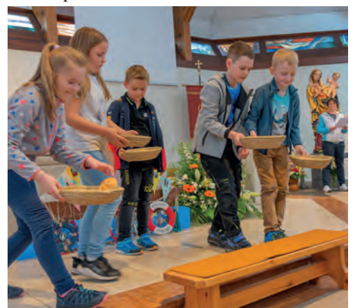
Generalprobe in Inzersdorf