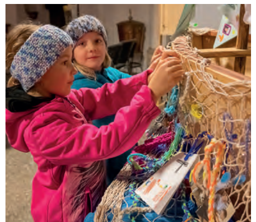
Vorbereitungszeit in Kirchdorf