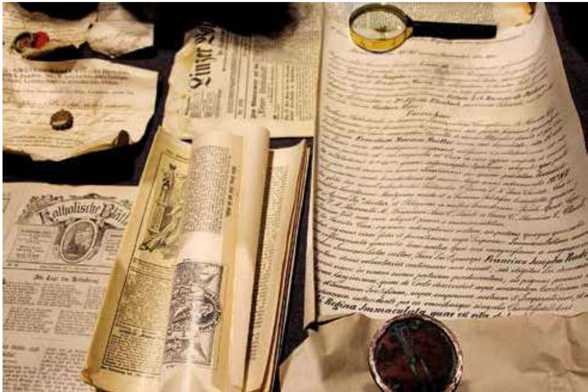
Blick auf die Zeitkapsel-Dokumente nach der Öffnung