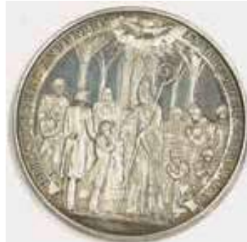
Firmmedaille Bischof Doppelbauers