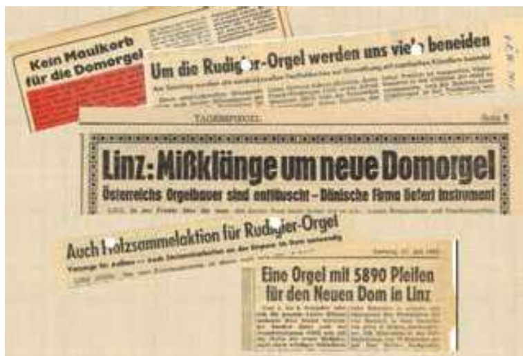
Presseberichte zur neuen Rudigierorgel DAL, Hermann Kronsteiner- Archiv, Sch. 11

vorträge usw. artikuliert. Es folgt das Verlangen nach Aufstellung der Orgel in der Linzer Diesterweghalle oder künftigen Brucknerhalle, weil das Instrument für die Liturgie zu gut sei und für Konzerte viel mehr genutzt werden müsse. Schließlich wird Kritik an den Kosten dieses „Hobbys einiger Musikfanatiker“ geübt usw. Als Antwort wurde all dem (von der Redaktion des Blattes) eine energische Klarstellung entgegengehalten, von der hier Punkt 1 referiert sei: „Kritiker, die heute gegen die Rudigierorgel aufstehen, sind zu spät aufgestanden. Sie hätten schon vor zehn Jahren ihren Mund aufmachen müssen. Schon 1958 war im Kirchenblatt von der geplanten Domorgel zu lesen und die Jahre her zu wiederholten Malen.“ 9 Überhaupt fand die Rudigierorgel in der Presse reges Interesse; ein dickes Paket von Zeitungsartikeln im vom Diözesanarchiv verwahrten Nachlass Hermann Kronsteiners gibt davon Zeugnis.