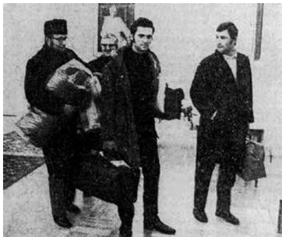
Die streikenden Kapläne im Bischofshof aus einem Bericht der OÖ Nachrichten 12/1971

ein, um sich für einen Kollegen einzusetzen, der sich – vom Vatikan laisiert – in seiner bisherigen Pfarre mit seiner Frau niederlassen wollte. Doch das Dekret wurde in der bischöflichen Kurie zurückgehalten, da ein Verbleib in der Pfarre nicht vorgesehen bzw. gewollt war. In den Medien wird ausführlich darüber berichtet – und wieder haben die Revoluzzer Erfolg. Der Diözesanbischof lenkt schlussendlich nach einem Kompromiss – nach Vermittlung durch Weihbischof Wagner – ein. Damit hatte auch die Diözese ihren „68er-Skandal“. Einer der damaligen Kapläne meint heute zur damaligen Situation: „Was 1968 in der Gesellschaft allgemein gelaufen ist, hat in der Kirche schon Jahre vorher begonnen.“ 26