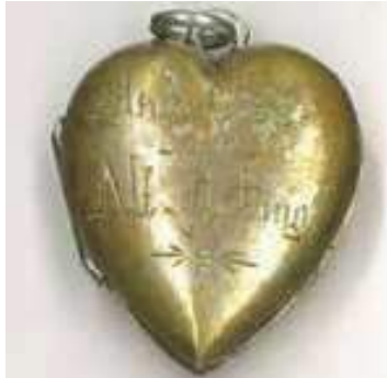
Altöttinger Reliquien- medaillon