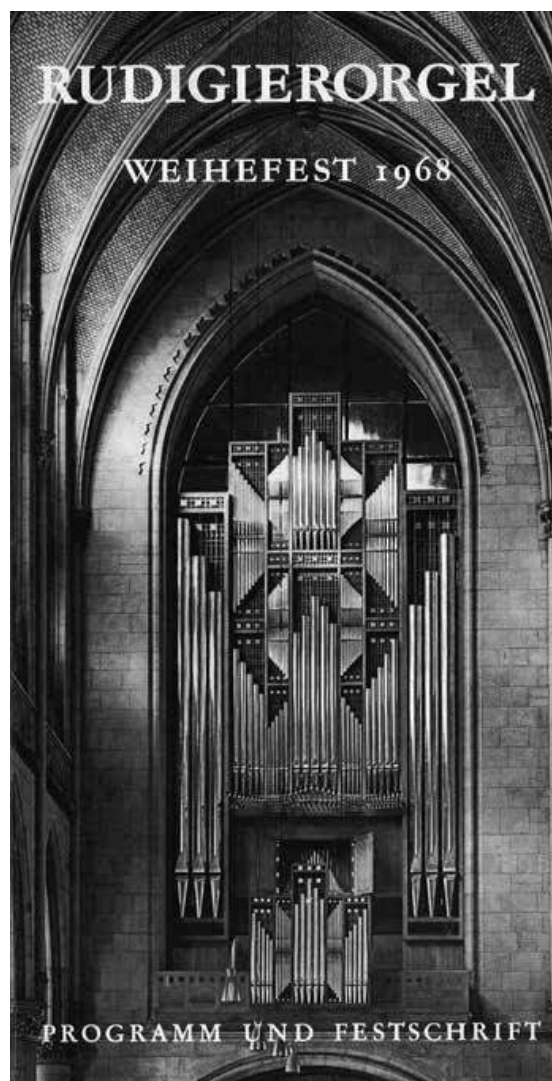
Festschrift zur Orgelweihe 1968