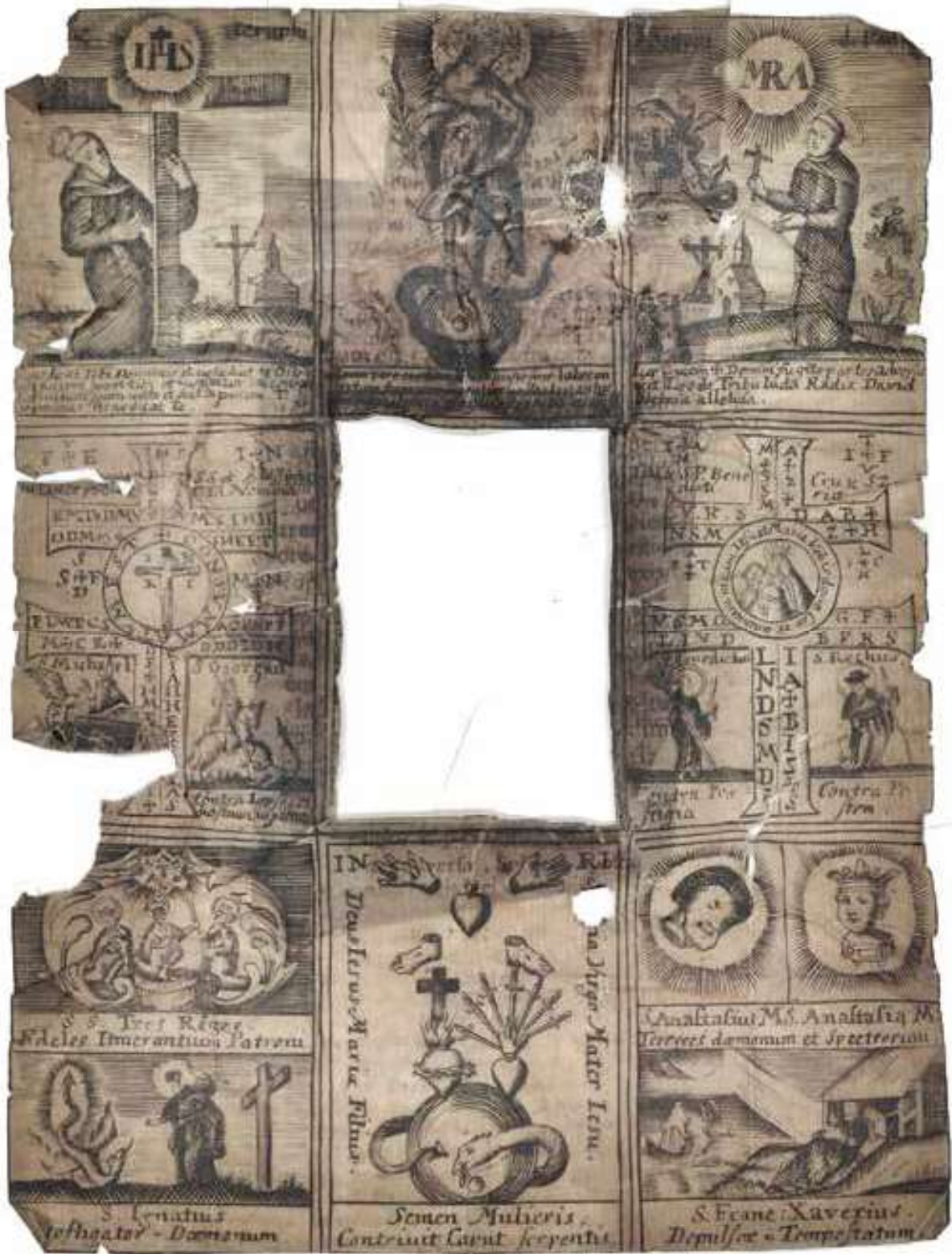
Brevel, Vorderseite, Zeitkapsel Pfarrkirche Schwand i. l.