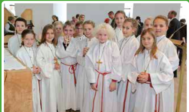
JS- und MINI-Aufnahme in Lichtenberg

Erscheinungsort: Linz-Pöstlingberg / Verlagspostamt: 4040 Linz P.b.b. GZ 02Z030687 DVR: 0029874 (1012)