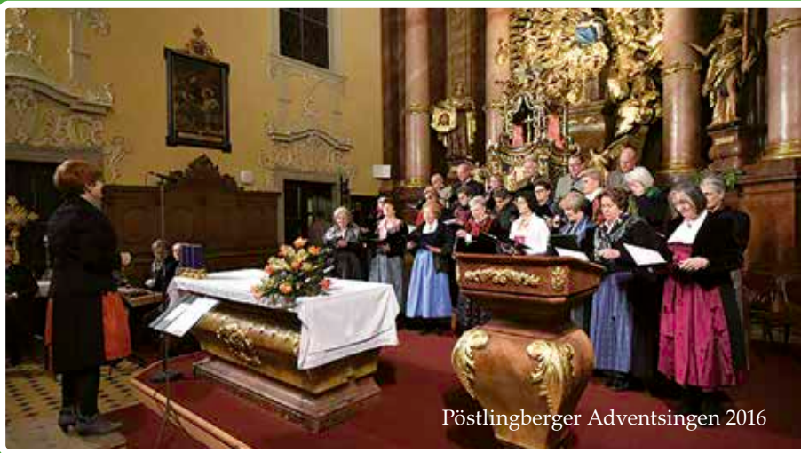
Pöstlingberger Adventsingen 2016