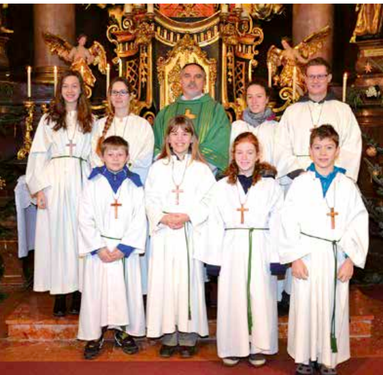
„Unsere Minis in guten, alten Zeiten ...“

Zu unseren Gottesdiensten, besonders zu den feierlichen, gehört, dass neben dem Priester auch Ministranten und Ministrantinnen mitfeiern. Diese feierliche Gestaltung wird immer schwieriger, da wir keine neue Ministranten und Ministrantinnen bekommen.