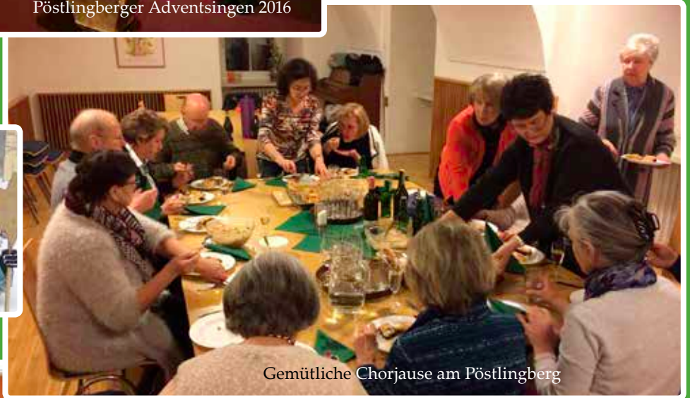
Gemütliche Chorjause am Pöstlingberg