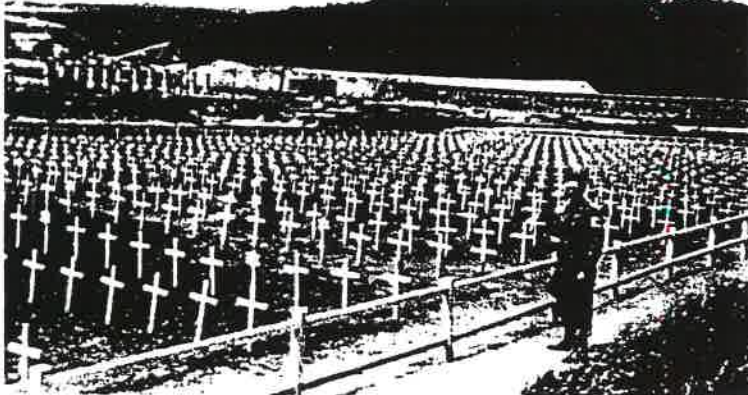
2.000 sind noch nach der Befreiung gestorben.

Heute ist meine innere Bewegung auf dem Höhepunkt. Dank unserer gemeinsamen Initiative, meine österreichischen Freunde, werde ich jetzt auf dem Boden seiner letzten Pfarre ihm in Eurer Anwesenheit eine letzte Ehrenansprache halten können. Anschließend werden wir eine Erinnerungstafel am Krematorium