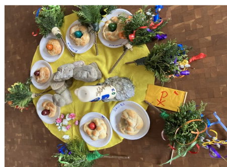
Die Mitte zum Thema Ostern

Vielen Dank besonders auch an die Frauenrunde, die mit den Familien Palmbüschen banden.