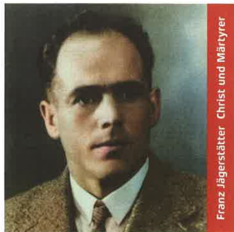
Franz Jägerstätter Christ und Märtyrer

Kontakt: 0732/7610-3813 oder behelfsdienst@dioezese-linz.at