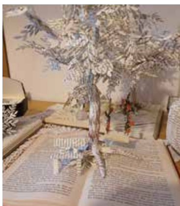
Romantik unter dem Baum