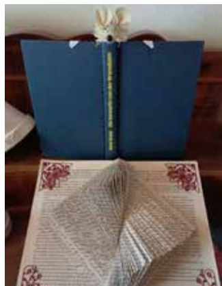
Das neugierige Buchmäuslein

Der Adventmarkt findet heuer wie immer am ersten Adventsonntag, den 3. Dezember , im Pfarrheim Micheldorf statt. Neben Bücherkunstwerken können dort unter anderem auch wieder Gestecke, Türzöpfe oder Kekse erworben werden. Wir freuen uns auf zahlreiche Besucher*innen!