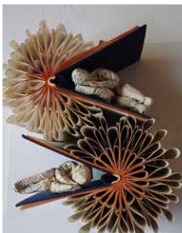
Beim Lesen kann man schon müde werden