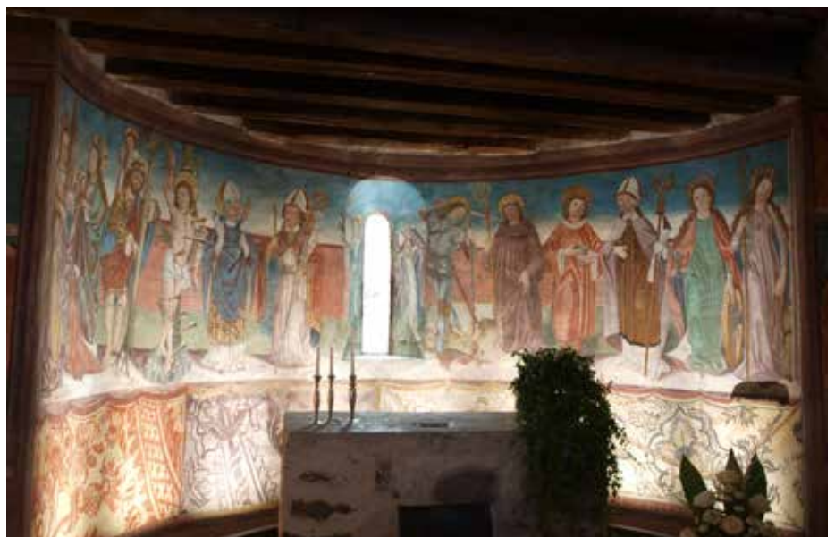
„Die 14 Nothelfer“ - Fresko von Simon von Taisten im Schloß Bruck in Lienz (1490-96)