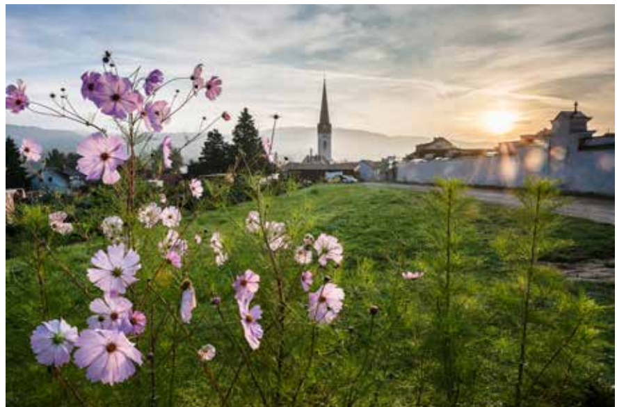
September 2016, Friedhof vom Schrebergarten aus gesehen

Heuer findet am Nachmittag des 1. November kein Gottesdienst in der Kirche statt. Das Totengedenken beginnt um 14 Uhr am Friedhof.