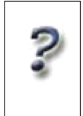
Obmann FA Finanzen