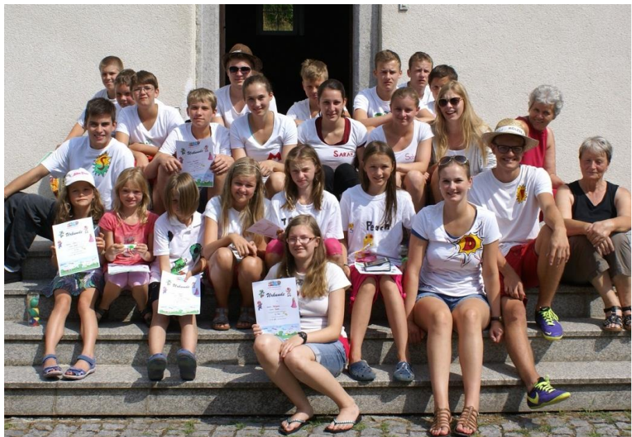
Jungschargruppenfoto in St. Oswald bei Freistadt

Natürlich freuen wir uns immer wieder über neue Gesichter.