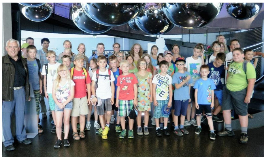
Minis von Traberg und Oberneukirchen in den VOEST-Stahlwelten

Herzlichen Dank jenen Ministranten für den bisherigen Dienst, die nun aufgehört haben und wünschen den "Neuen" Minis viel Freude.