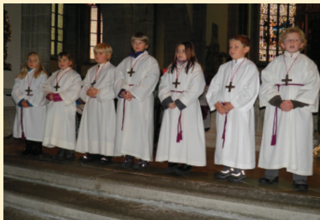
Vier Mädchen und drei Buben wurden am 12. Dezember feierlich in den Kreis der Ministrantinnen aufgenommen