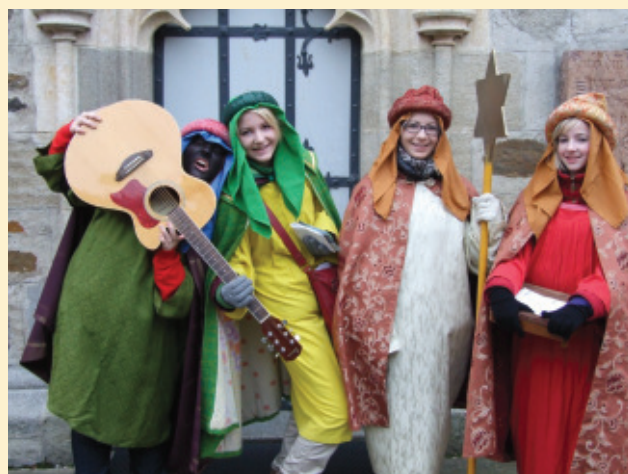
Dank vieler Kinder, Jugendlicher und Erwachsener konnte die Sternsingeraktion wieder sehr erfolgreich durchgeführt werden. 21.869,56 € wurden ersungen. Danke an alle SpenderInnen und SammlerInnen