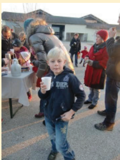
Nach der Winterwanderung am 8. Dezember konnte man sich mit heißem Tee wieder aufwärmen