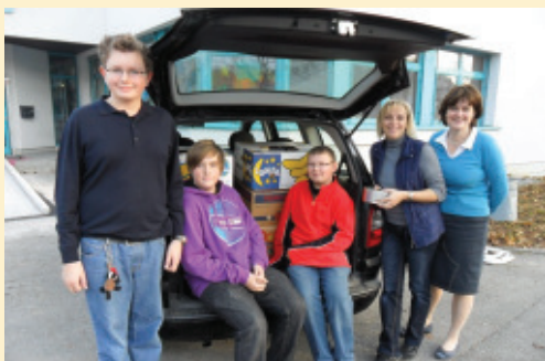
Die NMS Eferding Nord beteiligte sich an der von ora international initiierten Aktion und sammelte Lebensmittelpakete für bedürftige Familien in Albanien, Rumänien und Moldawien