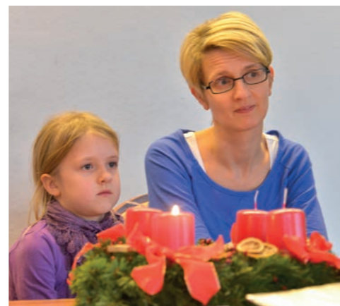
Die Bilder rechts zeigen Nikolausbesuche in unserer Pfarre.