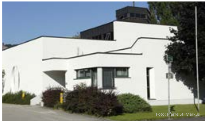
St. Markus, ehemals Kaplanei Gründberg