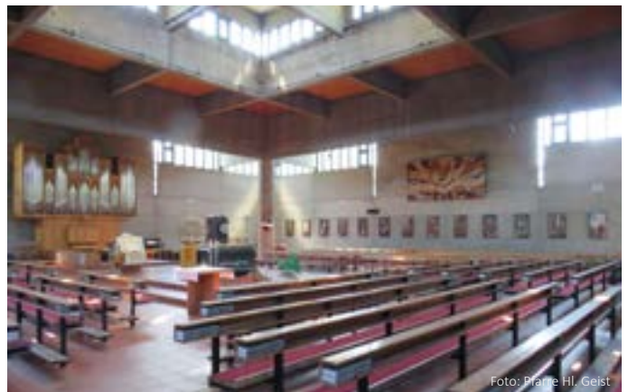
Heiliger Geist: Pfarrkirche in Sichtbetonbauweise