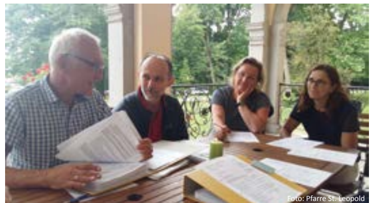
Seelsorgeteam Pfarre St. Leopold