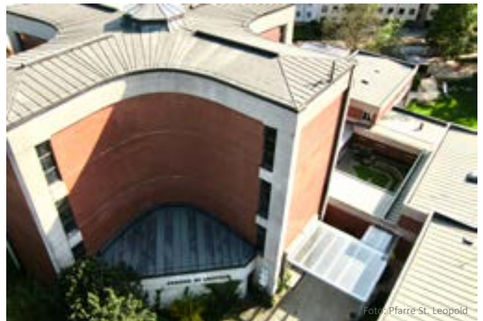
Kirche mit kreuzförmigen Grundriss, St. Leopold

*Gekürzte Fassung. Sie finden den Artikel in voller Länge auf der Dekanatshomepage