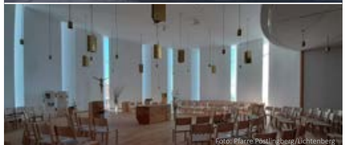
Alles neu in Lichtenberg: Kirche und Pfarrheim