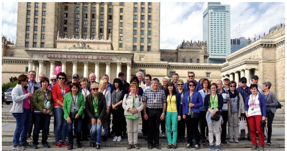
Vor dem Kulturpalast im Zentrum Warschau

Nach Rom 2015 und Assisi 2017 führte die diesjährige Tour durch Südpolen. Führungen in Breslau, Posen, Warschau, Tschenschostochau, Krakau und Auschwitz, die Fahrt durch das Land, der gesellige und lustige Aus-