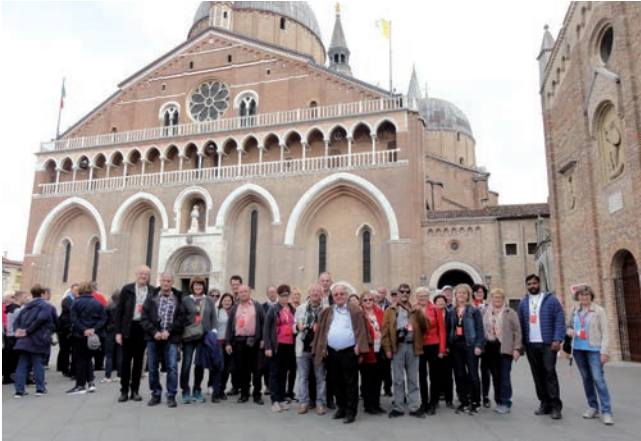
Basilica di Sant' Antonio in Padua

Die Pfarrreise der Pfarren Prambachkirchen und Stroheim 2019 führte uns in der Zeit vom Ostermontag, 22. April - Samstag, 27. April nach Assisi.