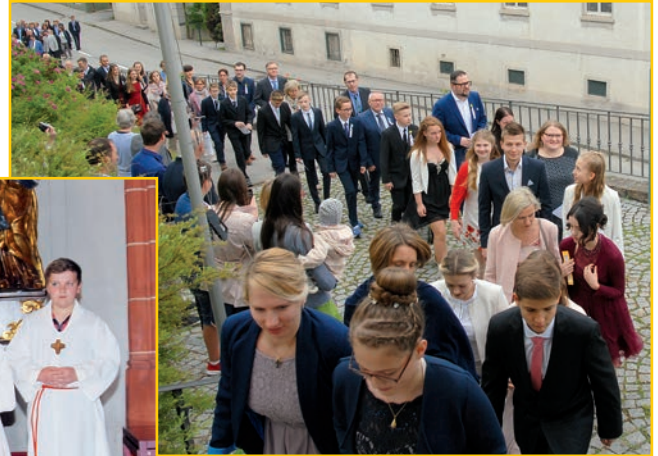
Einzug in die Kirche zur Firmmesse

Am Sonntag den 26. Mai fand der Höhepunkt, auf den wir einige Monate in der Firmvorbereitung hingearbeitet haben, das Fest der heiligen Firmung, in der Pfarrkirche Prambachkirchen statt.