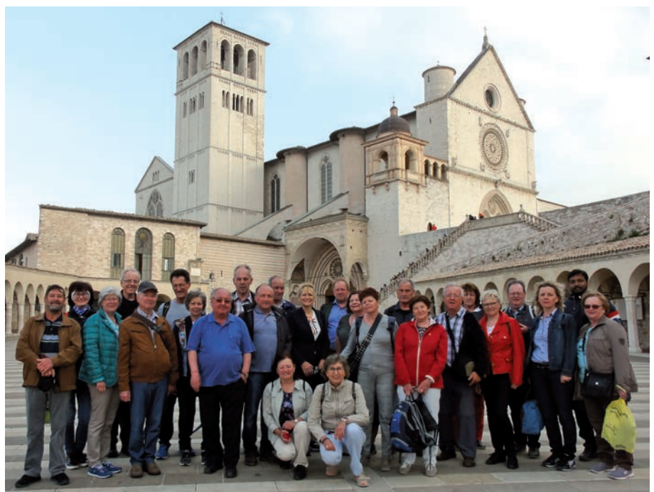
Franciscus Basilica in Assisi