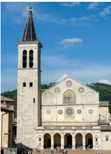
Dom von Spoleto

Zuerst ging es nach Padua, wo wir unter anderem die Basilika des hl. Antonius besuchten. In Ravenna konnten wir am nächsten Tag die berühmten frühchristlichen Mosaikbestandteile bewundern, bevor wir nach Umbrien, in das „grüne Herz“ Italiens weiter fuhren. Drei Mal nächtigten wir in Assisi, der Stadt des hl. Franziskus und der hl. Klara. Auf dem Programm standen natürlich alle Stätten dieser Heiligen, wobei neben der Franziskuskirche auch das Kloster San Damiano und die Einsiedelei Carceri besondere Eindrücke hinterließen. Ein Ausflug nach Spoleto und in das mittelalterliche Montefalco rundete die Zeit in Assisi ab. Die Heimfahrt