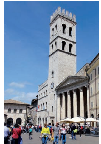
Stadtplatz von Assisi mit Minerva Tempel