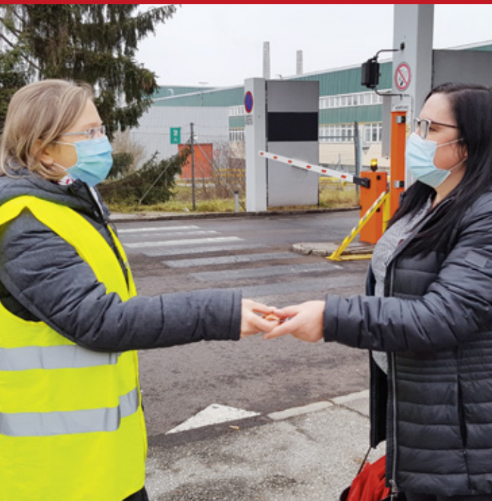
Weihnachtswünsche der Betriebsseelsorge für die Mitarbeiter*innen von MAN, 2020