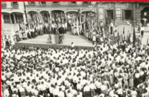
Treffen der Katholischen Arbeiter*innen- jugend 1956 am Stadtplatz in Steyr