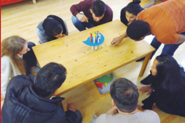
Spielerisch Lernen – ein Workshop mit Lehrlingen, 2018