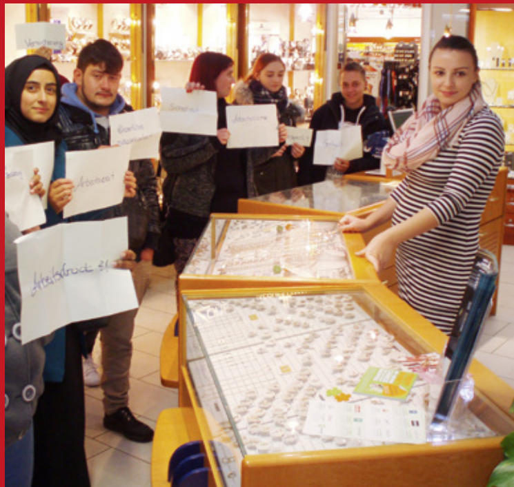
Aktion im öffentlichen Raum: „Was macht Arbeitslosigkeit mit den Menschen?“, 2016