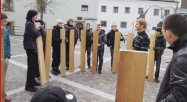
Brücke der Solidarität – stabil und fragil zugleich – jede und jeder ist Teil der Gemeinschaft, 2012