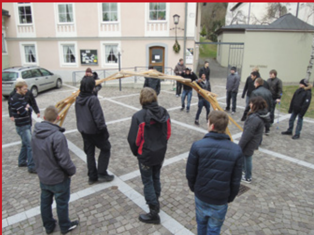
Brücke der Solidarität – alle haben ihren Platz und ihre Verantwortung, 2012