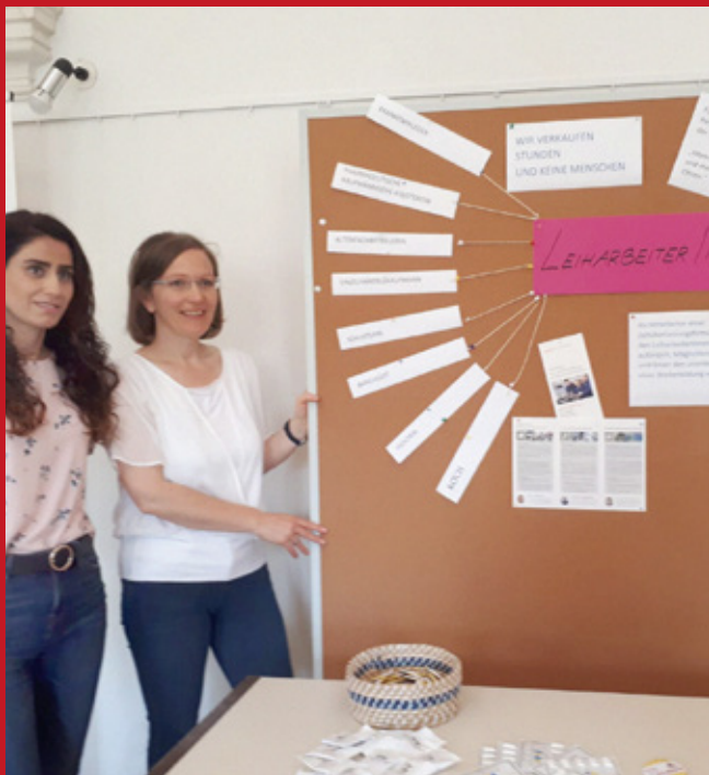
Informationsstand zum Thema „Leiharbeiter/-in“ am Tag der Arbeitslosen 2019

„Niemanden hatten die Menschen einen so wachen Sinn für Freiheit wie heute und gleichzeitig entstehen neue Formen von gesellschaftlicher und psychischer Knechtung.“ 21