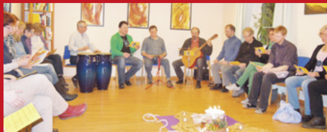
Gemeinsamer Gottesdienst im Treffpunkt mensch & arbeit Steyr, 2013