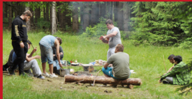
Tage in der Wildnis – Lehrlinge üben Eigenständigkeit und Verantwortung, 2015