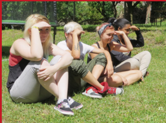
Eine Methode der Katholischen Arbeiterjugend: Sehen – Urteilen – Handeln – Feiern, 2016