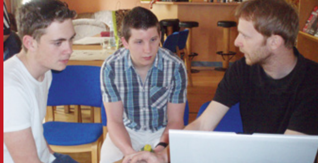
Gemeinsam etwas entwickeln und dabei das eigene Potenzial fördern – Workshop mit Lehrlingen, 2013