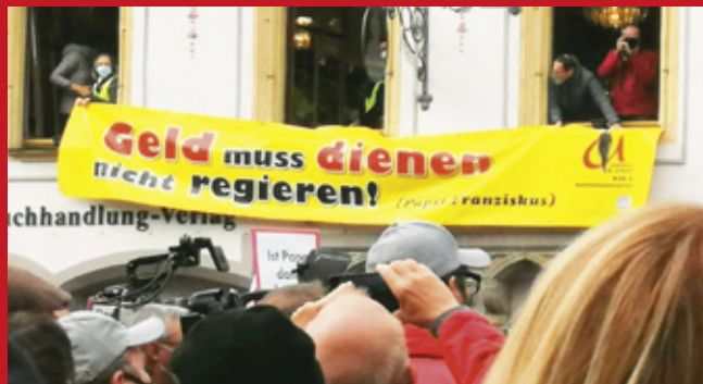
Transparent der Betriebsseelsorge bei der Kundgebung gegen die Schließung des MAN-Werkes in Steyr am 15. Oktober 2020