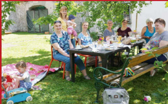
Frauen-Frühstück im Garten des Treffpunkt mensch & arbeit

Seit acht Jahren findet am Mittwochvormittag das Frauen-Frühstück statt. Frauen treffen sich, um miteinander Alltagserfahrungen aus Familie und Beruf auszutauschen und um Kontakte zu knüpfen. Verschiedene Sichtweisen helfen, eigene Wahrnehmungen zu reflektieren und voneinander zu lernen. Am ersten Mittwoch im Monat wird der Vormittag zu einem, von den Frauen selbstgewählten Thema gestaltet.