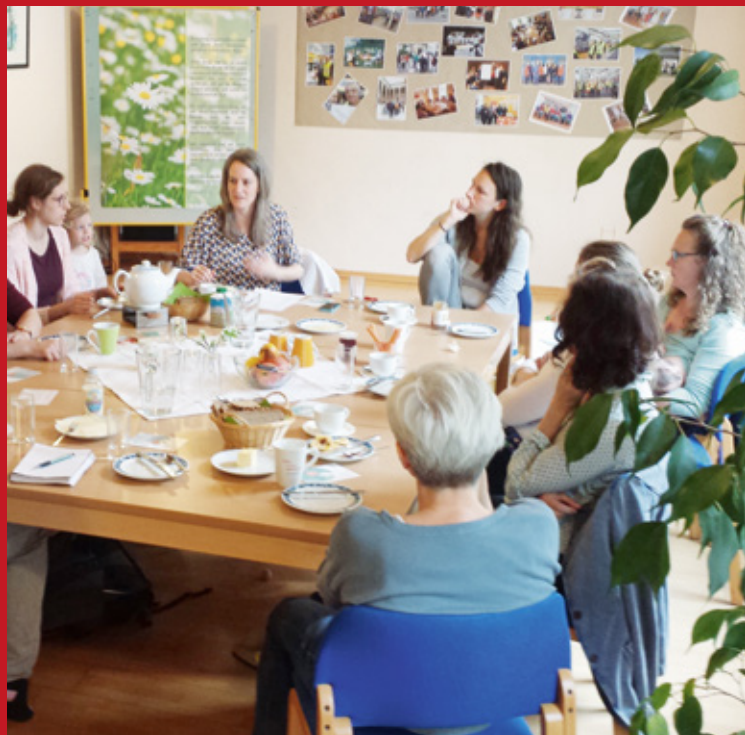
Frauen-Frühstück im Treffpunkt mensch & arbeit Steyr, 2019