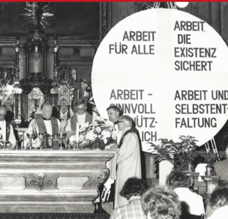
Gottesdienst mit Kardinal Franz König zum Thema „Arbeitslosigkeit“, 15. Mai 1987 in der Kirche St. Michael