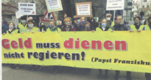
Die Steyrer Christ*innen zeigen ihre Solidarität.

Kirche zeigt sich solidarisch mit MAN-Belegschaft in Steyr