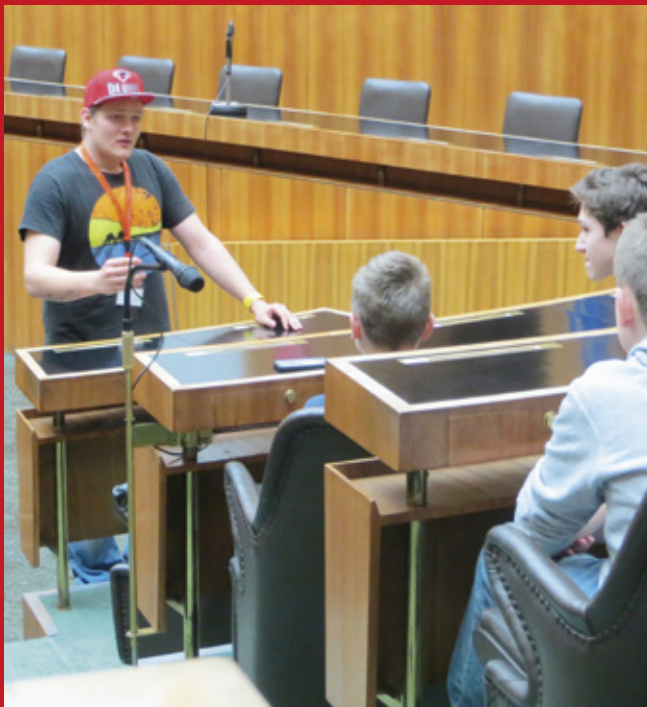
Verantwortung übernehmen in der Gesellschaft – Besuch im Parlament, 2015