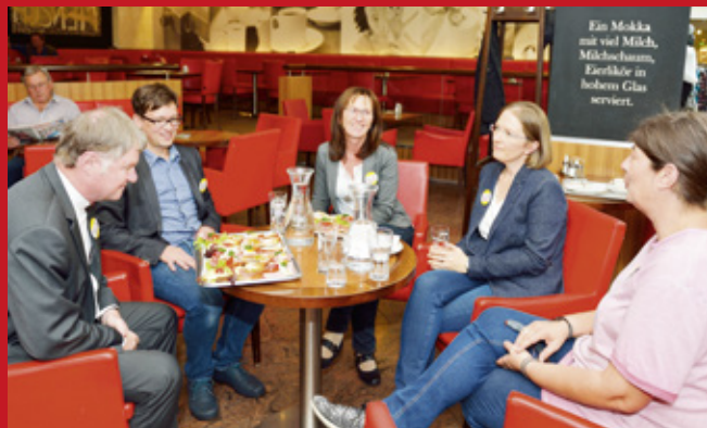
Besuch von Bischof Manfred Scheuer bei den Mitarbeiterinnen des Einkaufszentrums Taborland 2018