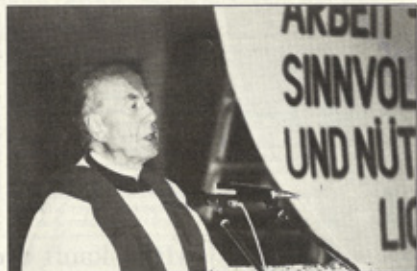
Kardinal König in Steyr: Arbeitslosigkeit geht alle an.

In einem neuen Konkurrenzkampf, der der Ungerechtigkeit oft neue Tore öffnet, müsse die Kirche ihre Stimme für jene erheben, die sich unterdrückt und ungerecht behandelt fühlen. Wesentliche Aufgabe der Diözesen sei es, in Arbeitskreisen und Studientagungen sich noch mehr mit der Frage und den verschiedenen Aspekten von Arbeitslosigkeit auseinanderzusetzen. Die gefährdeten Regionen müßten in