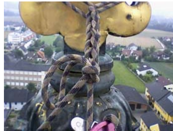
Am Übergang vom Kreuz aufs Dach klafft ein Riss

Mit der Zuversicht, ähnliche Fördersummen wie in Hilkering zu erhalten und der Hoffnung, dass uns die Pfarrbevölkerung, die Vereine und Institutionen auch diesmal wieder mit ihren Spenden helfen, werden wir uns heuer im Sommer über dieses Projekt wagen.