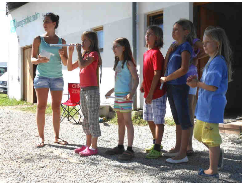
Bei vielen Spielen hatten die Kinder jede Menge Spaß

Da die richtigen Olympischen Spiele für Österreich leider ohne Medaillen ausgingen, hatten wir in Losenstein um einiges mehr Erfolg bei der Olympiade am Freitag. Am Samstag ging es dann nach einer sehr lustigen aber leider viel zu kurzen Woche wieder zurück nach Hause.