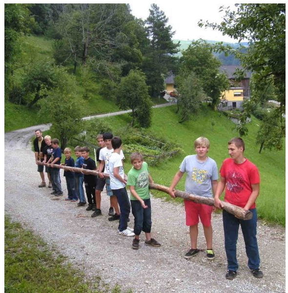
Viele Hände sind notwendig bis ein Wimpelmast gefunden ist!