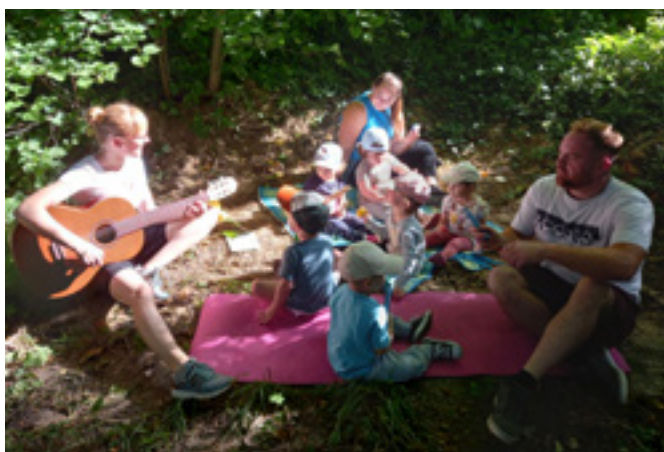
Morgenkreis im Wald