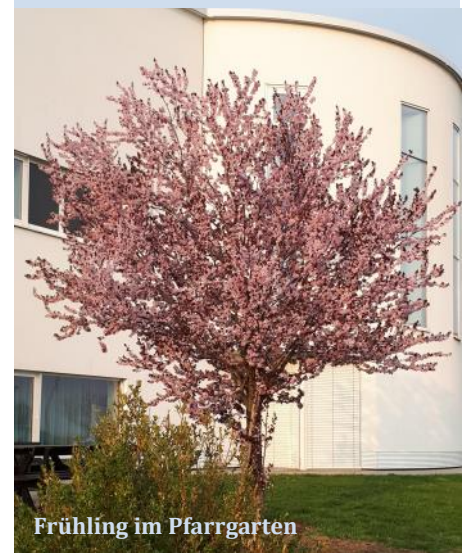
Frühling im Pfarrgarten