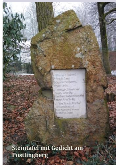
Steintafel mit Gedicht am Pöstlingberg