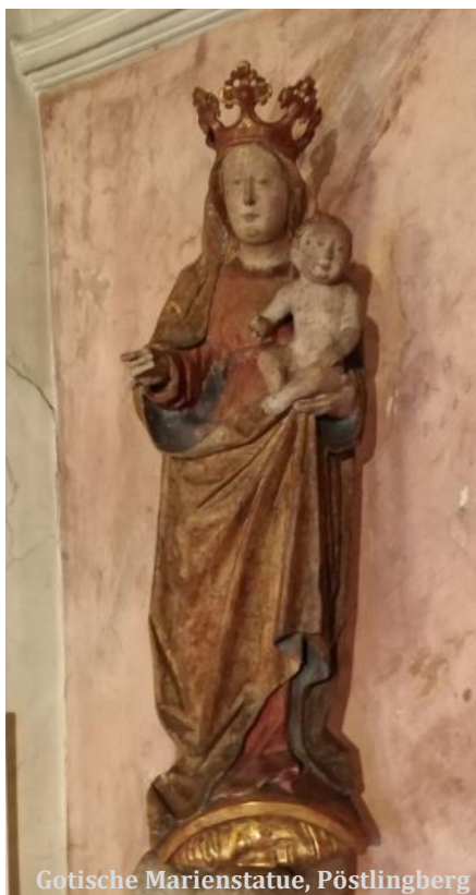
Gotische Marienstatue, Pöstlingberg

Dienstag, 26. Mai um 19.30: Steinerkapelle