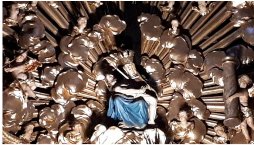
Pietà - Hochaltar Basilika Pöstlingberg