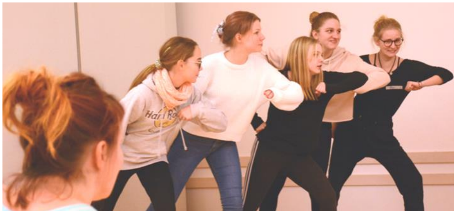
Die Proben für die Theaterproduktion sind in vollem Gange.