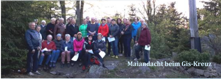
Maiandacht beim Gis-Kreuz

Bei Schlechtwetter finden die Maiandachten in der Kirche statt. Aktuelle Info im Onlinekalender auf der Homepage.