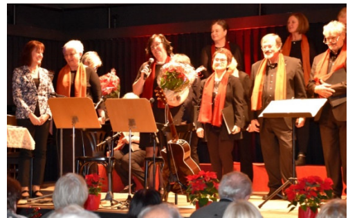
Adventkonzert-Ende: Verteilen von Weihnachtssternen an die Mitwirkenden