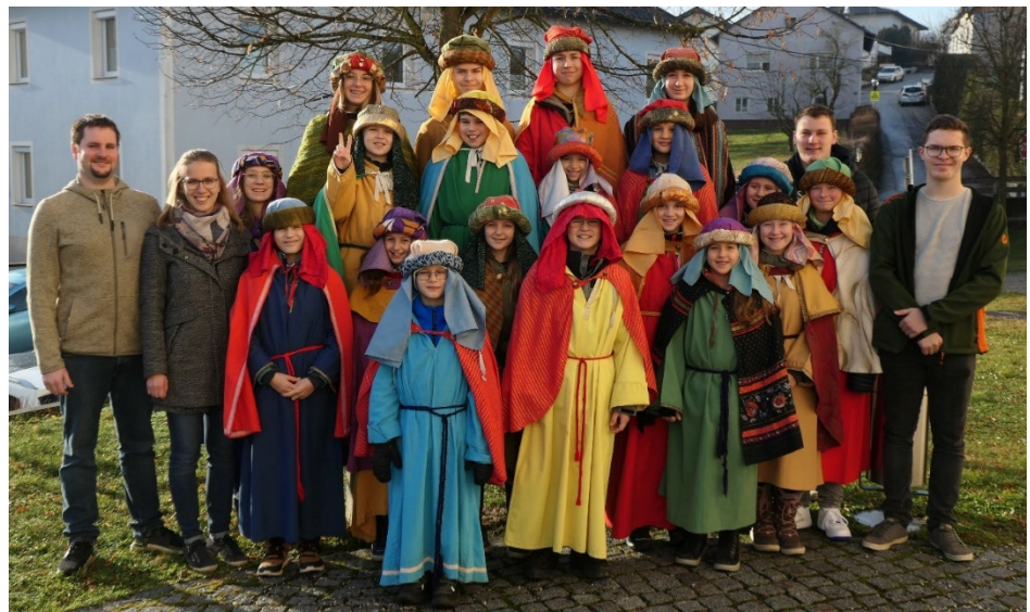
Die Sternsingerinnen und Sternsinger am 6.1.2023

Der Zusammenhalt in unserer Sternsinger-Gemeinschaft, die Freude und Herzlichkeit, mit der wir bei den besuchten Häusern empfangen wurden und die großzügigen Spenden machen das Sternsingen Jahr für Jahr zu etwas ganz Besonderem und Einzigartigem.