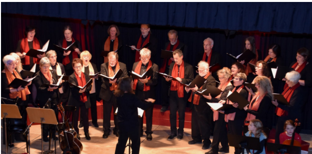
Advent in Ansfelden - unser Chorkonzert

Und am 26. Februar 2023 lud unser Chor zum Pfarrcafé, wo wir ganz viele Gäste mit köstlichen Mehlspeisen bewirten durften! Wir bedanken uns sehr herzlich bei allen fürs Kommen!