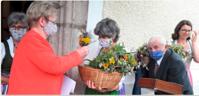
Weihe der Kräuterbüscherl zu Maria Himmelfahrt. Vielen Dank für die großzügige Spende, die wir unserem Pfarrer übergeben konnten