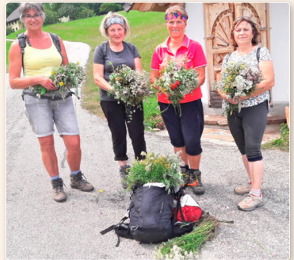
Kräuter- und Pilgerwanderung von Reindlmühl auf den Richtberg, mit Andacht in der Kirche in Reindlmühl, die dem Hl. Josef geweiht ist.