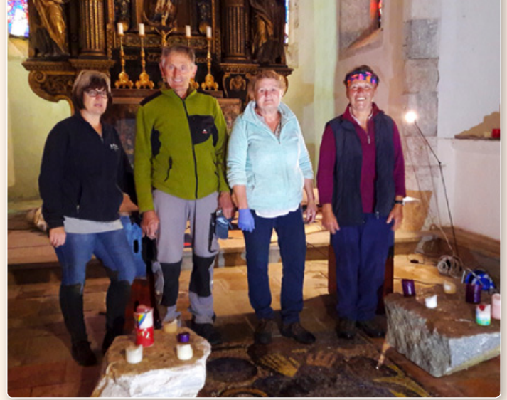
Ein großes DANKE an alle, die immer für Sauberkeit in der Pfarrkirche, Konradkirche und im Pfarrhof sorgen.