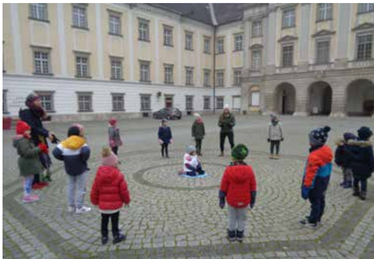
Das Team des Kiga Hofwiese