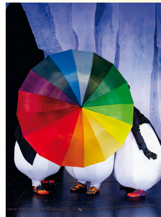
AN DER ARCHE UM ACHT

„School of Rock“ erzählt vom arbeitslosen Rockmusiker Dewey Finn, der sich als Musiklehrer ausgibt und einen Ausbildungsjob an einer Privatschule erhält. Dort scheint er zunächst fehl am Platz, begeistert dann aber seine Klasse dafür, eine Rockband zu gründen und an einem Bandwettbewerb teilzunehmen.