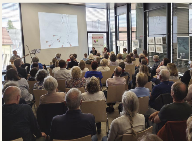
Volles Haus im Fokus