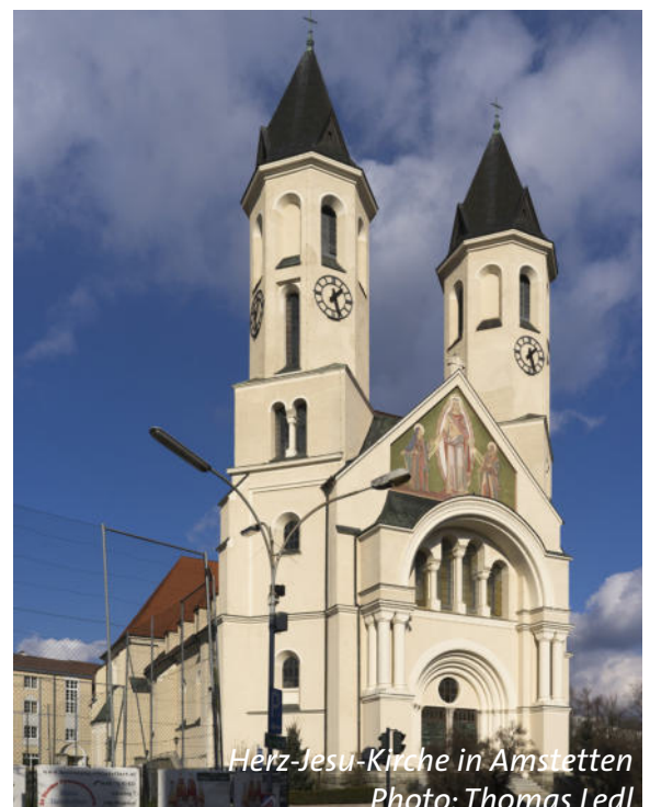
Herz-Jesu-Kirche in Amstetten

PS: Danke auch dafür, dass ich regelmäßig das Pfarrblatt bekomme!