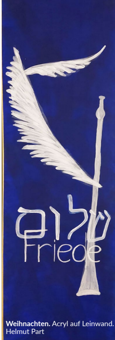
Weihnachten. Acryl auf Leinwand. Helmut Part