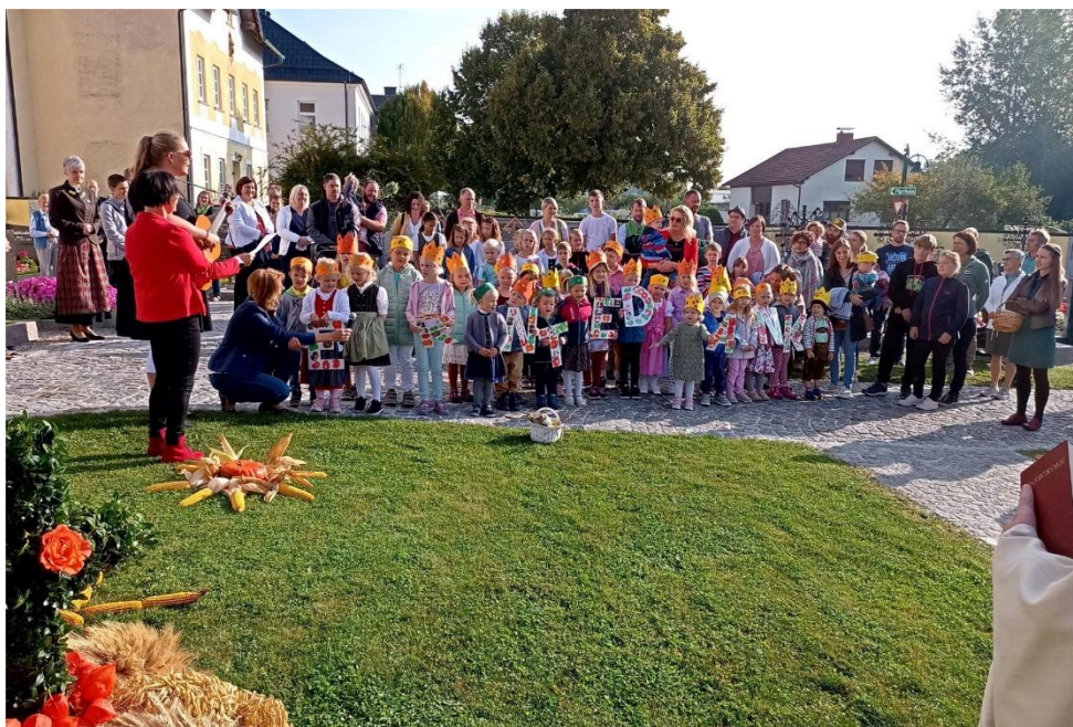
Auch die Kinder aus unserem Kindergarten beteiligten sich an der Feier und leiteten die Segnung der Erntekrone mit schwungvollen Liedern ein.