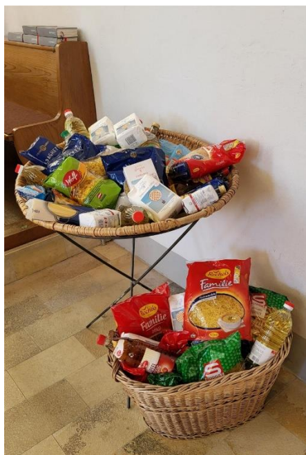
Vor der Feier wurden viele Lebensmittel-Spenden abgegeben.