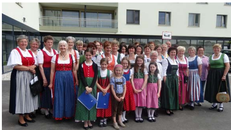
Ein wirklich großer Chor sang am 31. Mai bei der Maiandacht im Altenheim: Der Trachtenchor Hartkirchen erfreute die Bewohner.