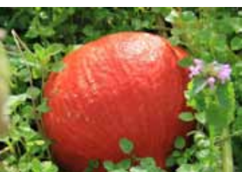
Erntedank, Foto: Gabriele Fröhlich

Alle sind herzlich zum Mitfeiern eingeladen.