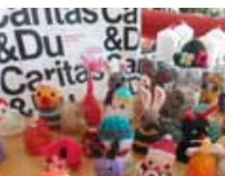
Häubchen stricken