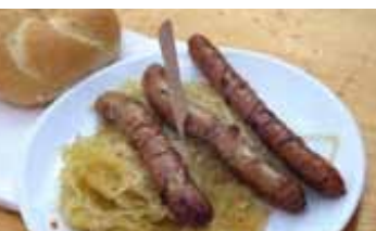
Tradition mit Geschmack

Der Pfarrgemeinderat ladet herzlich dazu ein!