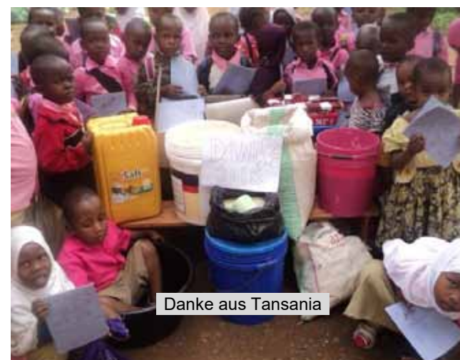
Danke aus Tansania