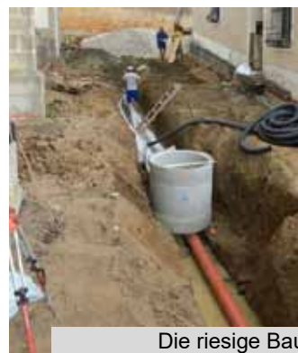
Die riesige Baustelle rund um die Kirche mit Koordinationsteam