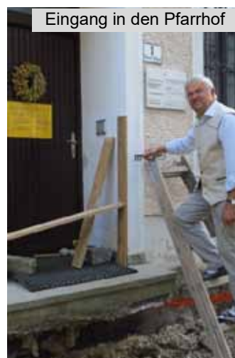
Eingang in den Pfarrhof