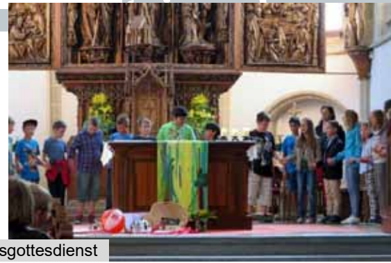
Auch die Lehrerinnen freuen sich auf die Ferien