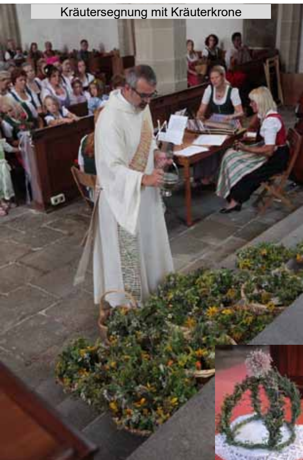
Kräutersegnung mit Kräuterkrone