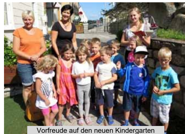
Vorfreude auf den neuen Kindergarten