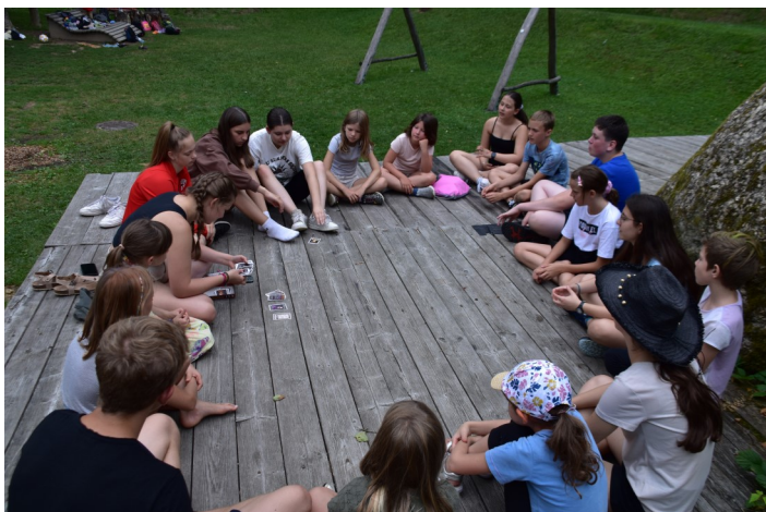
Jungchar- und Minitage 2022