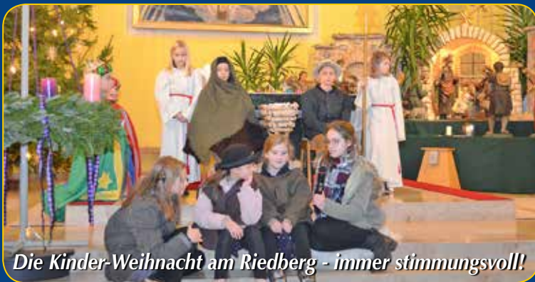
Die Kinder-Weihnacht am Riedberg - immer stimmungsvoll!