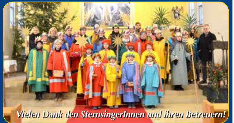
Vielen Dank den SternsingerInnen und ihren Betreuern!