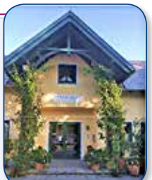
„Ein Haus voll Glorie schauet ...“ romantisches Pfarrheim Trumau Baden/Wien

Zum Schluß erleben wir Gestalten wie Ezechiel, Ester, Hiob und die Rückkehr in die Heimat.