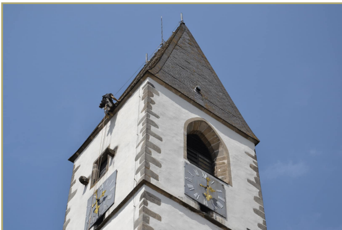
Die Turmhelmsanierung wurde durchgeführt.

Notwendige Teilsanierung der Bänke in der Pfarrkirche. Die extrem morschen Teile werden erneuert und die Bänke neu lasiert.