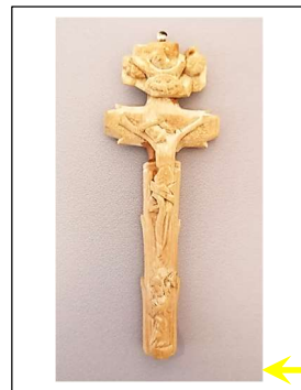
Abbildungen: Christian Koller

Die Gedenktafel im Eingangsbereich unserer Pfarrkirche mit dem von Camilla Estermann geschnitzten Holzkreuz.