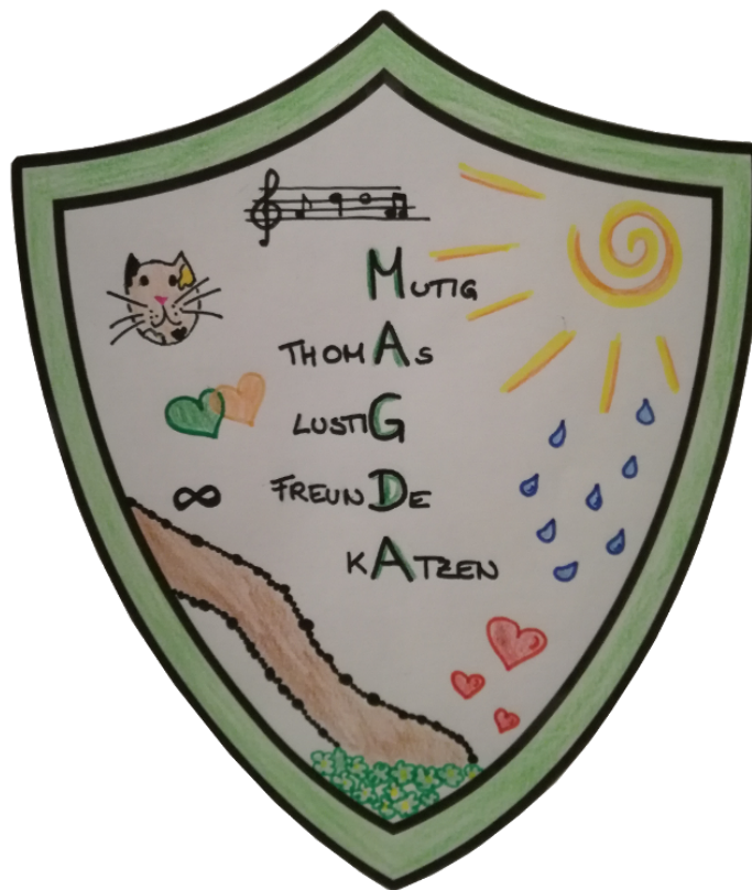
Persönliches Wappen gestalten beim Firmanmeldeabend