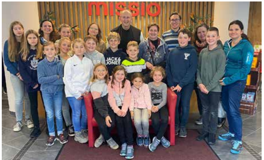
Das Ministrantenteam Kirchberg

Danke an alle, die uns unterstützt haben!