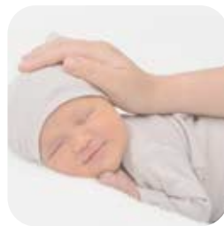
Lena Klaffenböck Taufe: 24. September