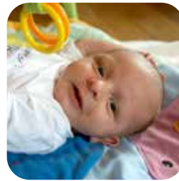
Moritz Schuster Taufe: 4. September