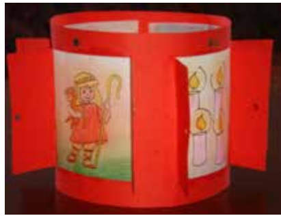
Jedes Kind durfte sich selbst so eine Tischlaterne zu Hause basteln.

Nach dem „Vater unser“ im Kreis vorne hörten die Kinder in der Sakristei die Geschichte vom „Hirten Simon“. Gespannt lauschten die Kinder der Fortsetzung, wie der Hirte Simon seine Lichter verschenkte.