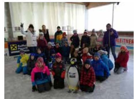
Eislaufen als Dank für's Sternsingen

Für unsere SternsingerInnen schon Tradition war wieder das Eislaufen in der Eishalle in Peuerbach. Es soll neben dem Sternsingergeschenk ein DANKE von der Pfarre sein für euren supercoolen Einsatz.