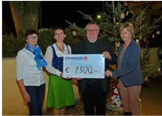
Die Bäuerinnen spendeten € 1500.- für die Renovierung der Pfarrkirche.

„Wer an das Gute im Menschen glaubt, der bewirkt das Gute im Menschen.“