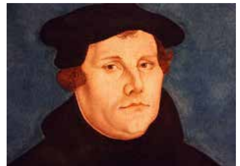
Martin Luthers Ziel war eine reformierte Katholische Kirche.