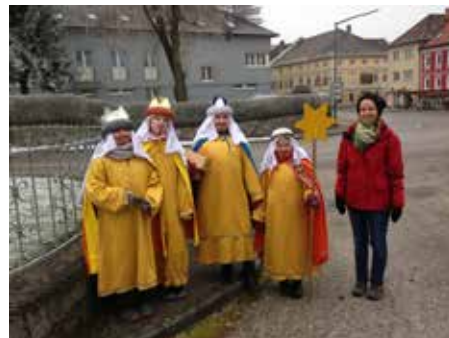
Mit vollem Einsatz bei Kälte, Schnee und Sturm unterwegs: Die SternsingerInnen mit ihren Begleitpersonen

Ein besonderer Dank gilt jedoch allen SpenderInnen für die erfreuliche Summe von € 12.981.