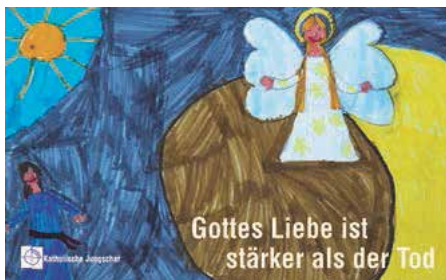
Plakat zur Ostergrußaktion

10:00 Uhr Gottesdienst mit Bischof Manfred Scheuer im Neuen Dom anschließend Jause